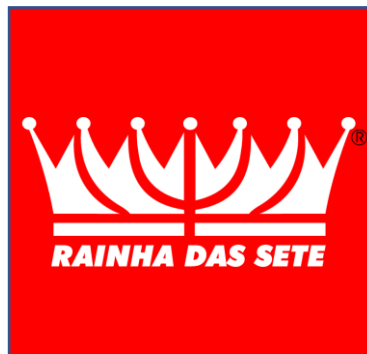
VERSÃO PREFERENCIAL NEGATIVA