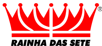
VERSÃO PREFERENCIAL POSITIVA